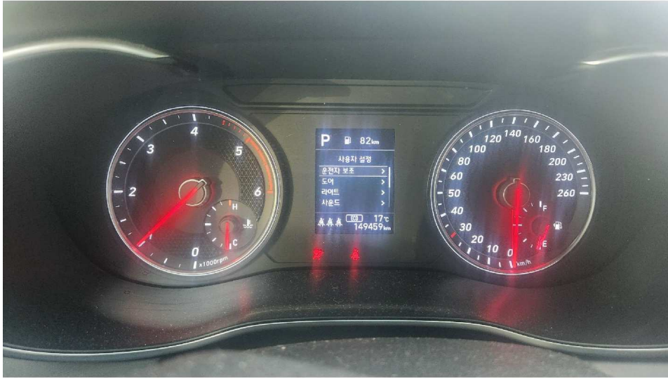
차량계기판 (주행거리 : 149,459KM)