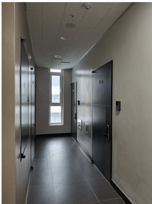
대상물건 및 통로