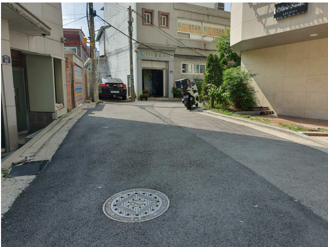
주 위 환 경