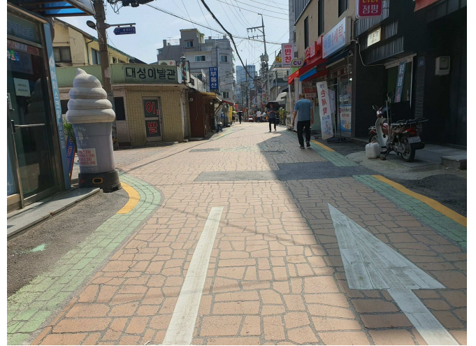
주 위 환 경