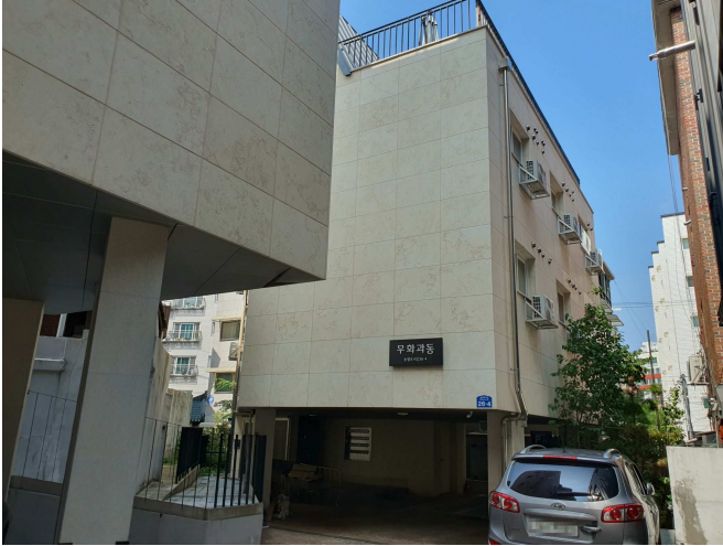
본건 건물 전경