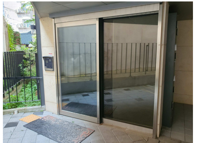
지 상 출 입 부