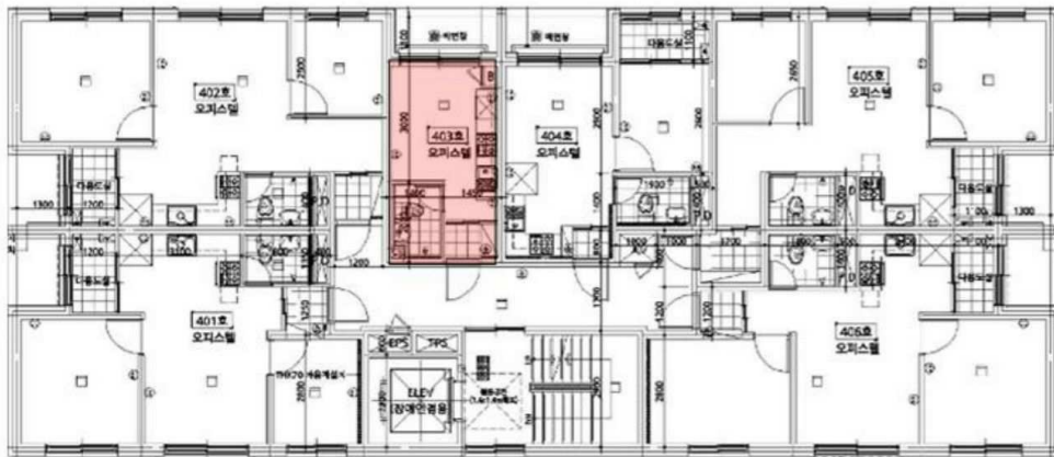
[ 호별배치도 ]

소재지 서울특별시 성북구 하월곡동 90-1817외 명남더블레스 제4층 제403호