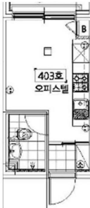
[ 내부구조도 ]