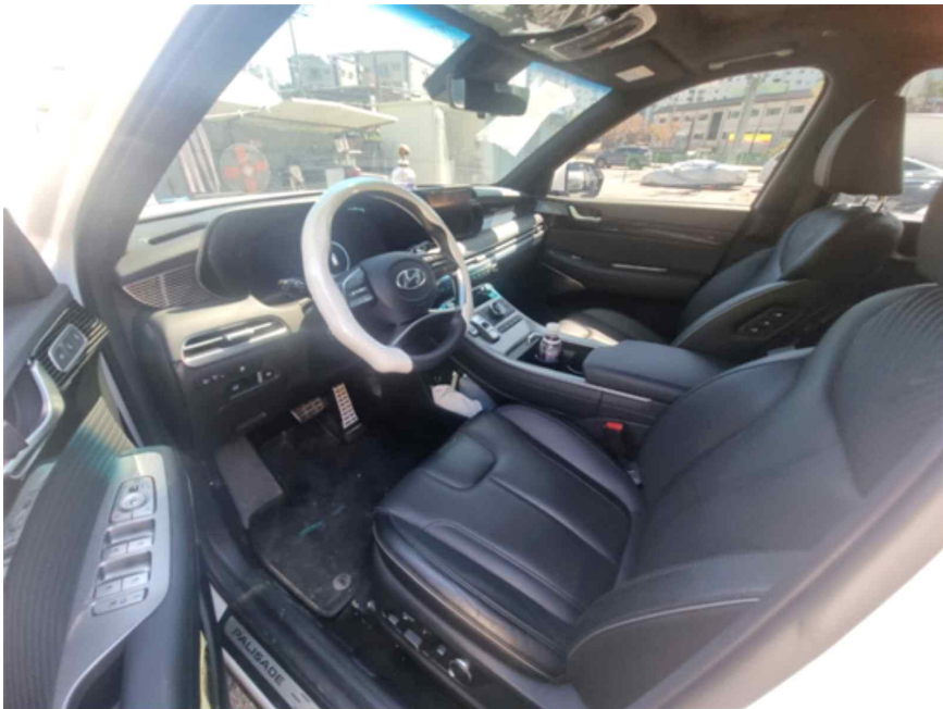
[ 차량내부 ]