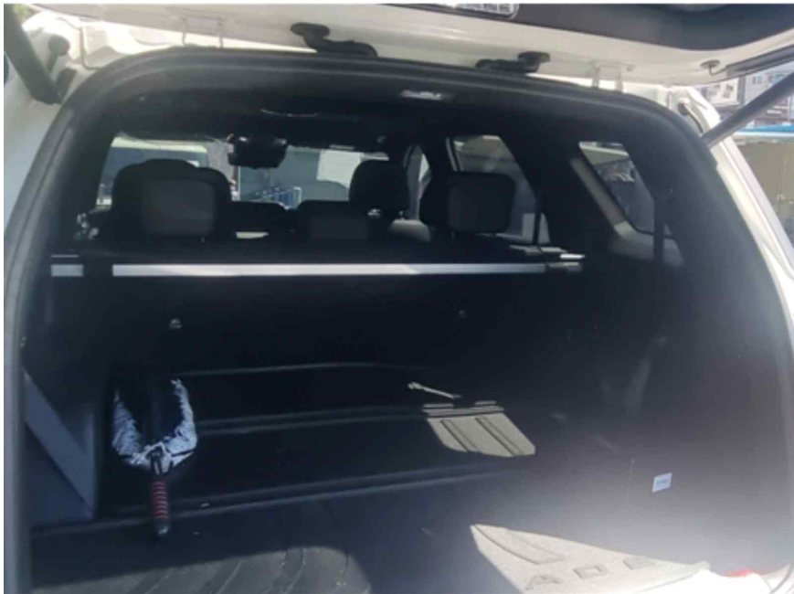
[ 트렁크 ]