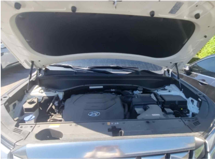
[ 엔진룸 ]