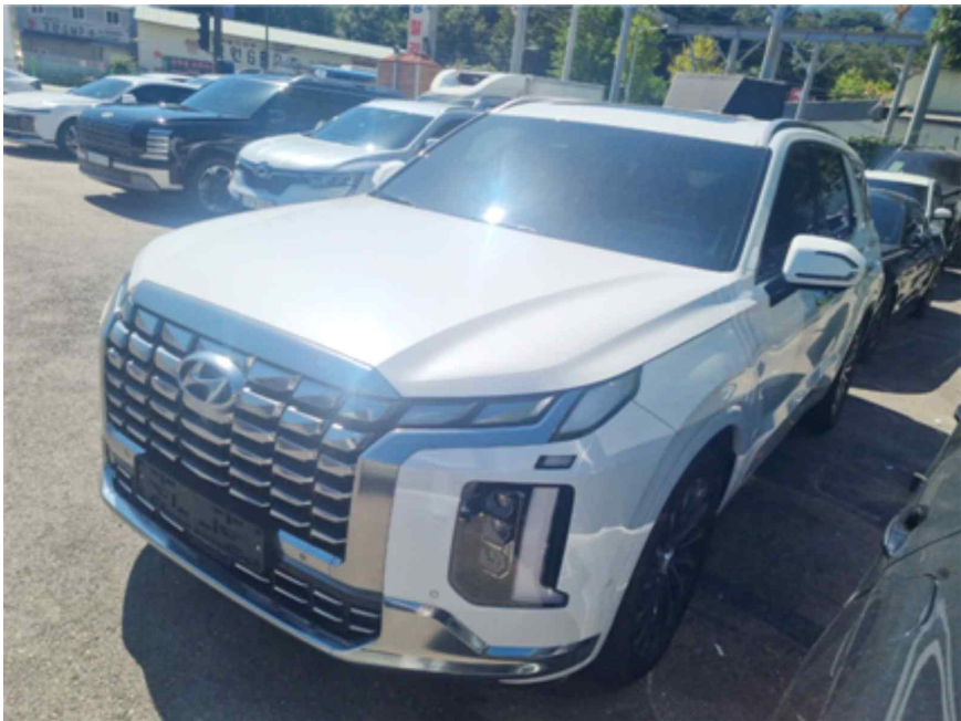
[ 본건 전경 ]