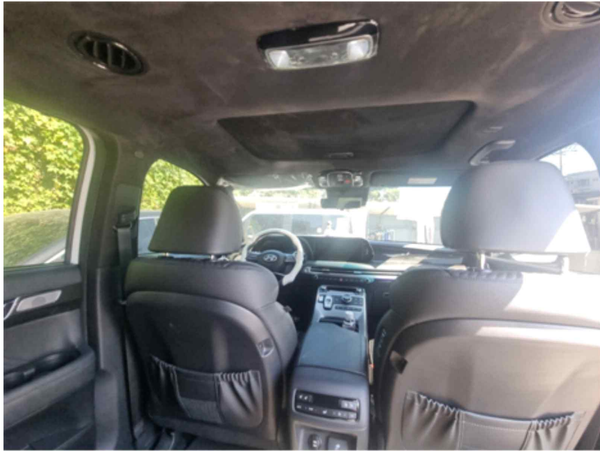
[ 차량내부 ]