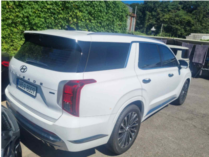
[ 본건 전경 ]