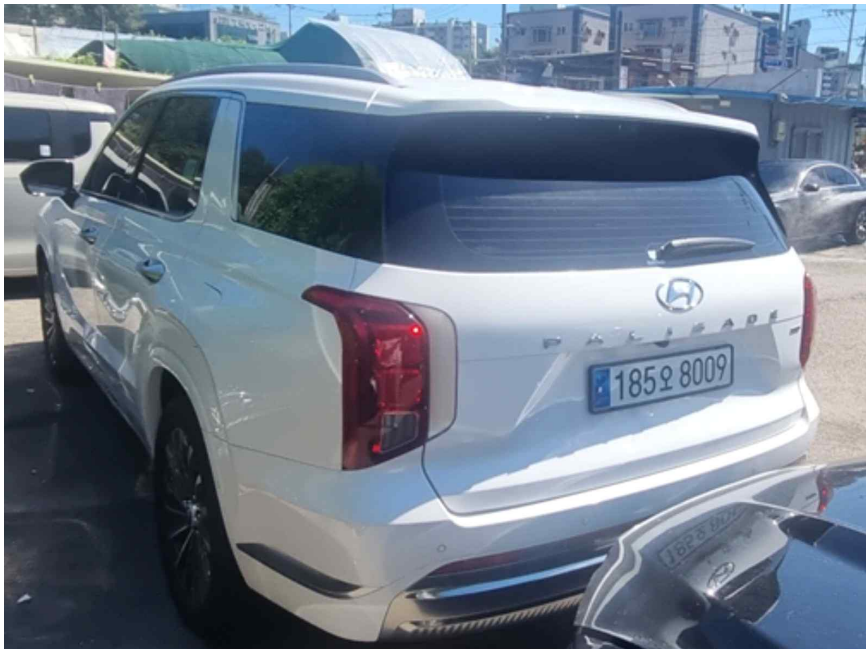
[ 본건 전경 ]