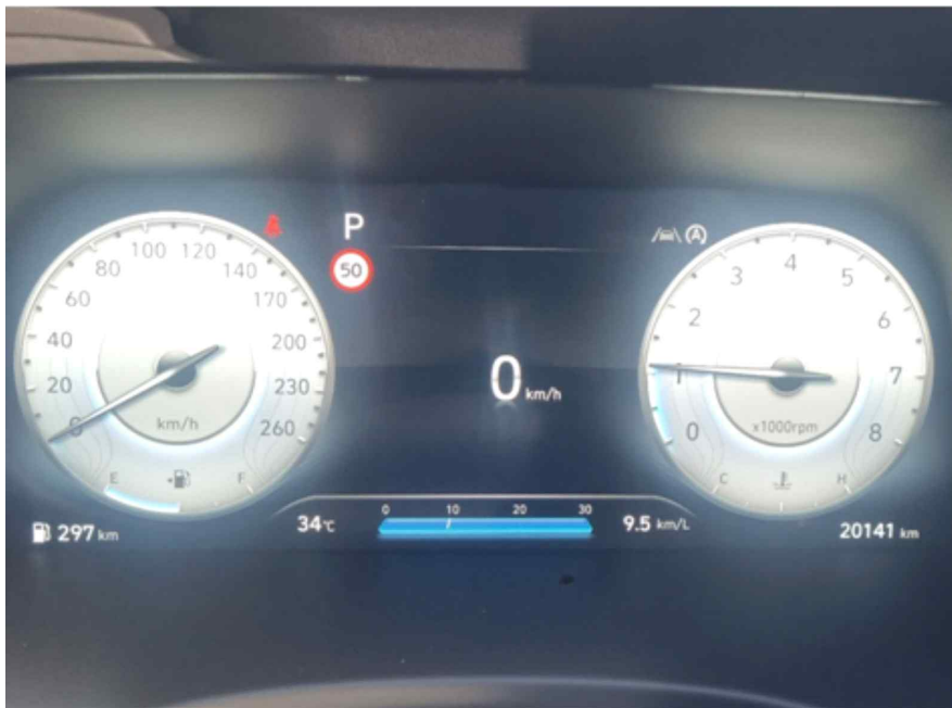
[ 계기판 ]