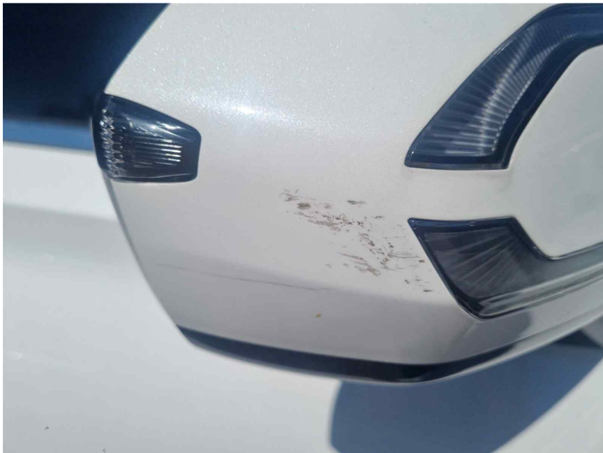
[ 사이드미러 ]