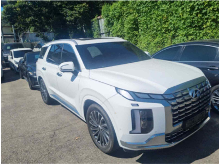
[ 본건 전경 ]