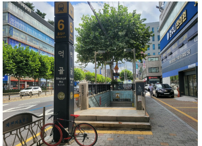
( 6 )