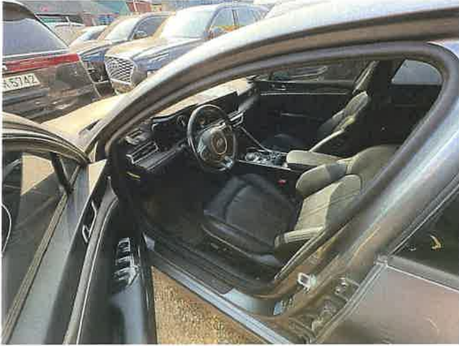
본건 차량 내부