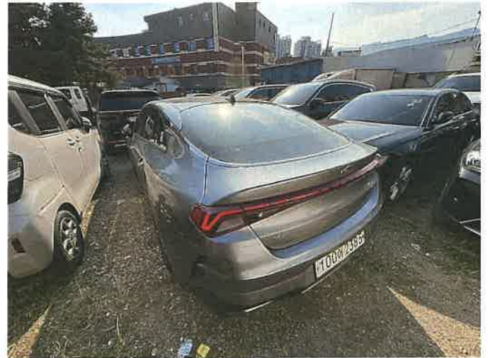
본건 차량 후면 전경