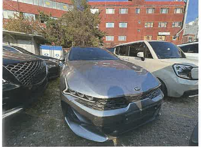
본건 차량 전경