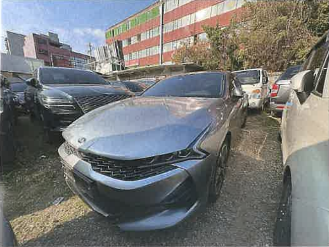
본건 차량 전경