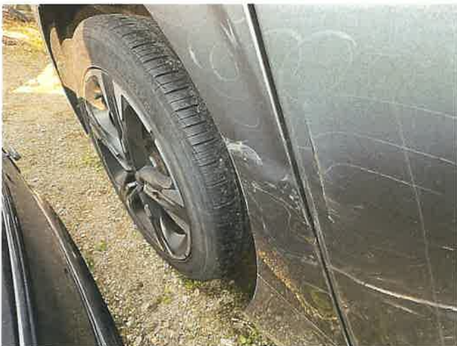
본건 차량 손상