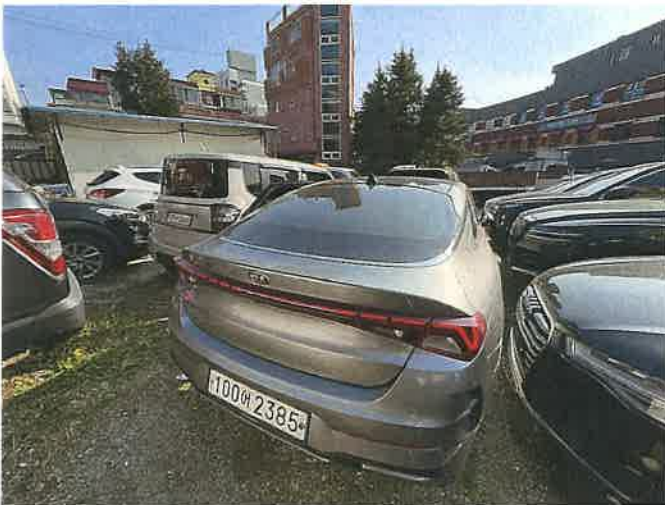
본건 차량 후면 전경