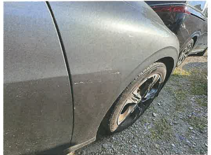
본건 차량 손상