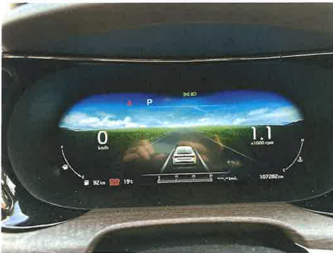
본건 차량 계기판