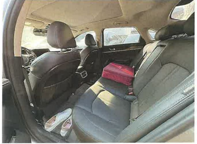
본건 차량 내부