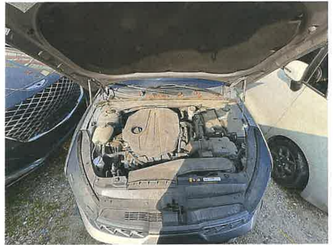
본건 차량 엔진룸