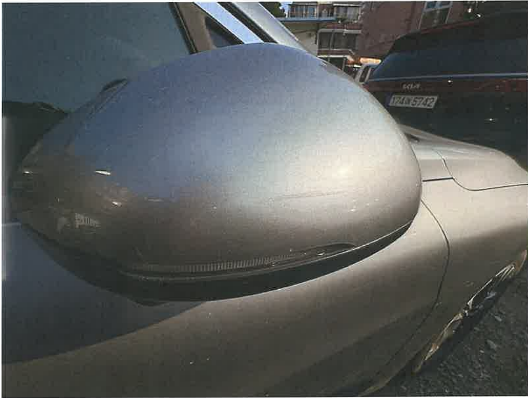
본건 차량 손상