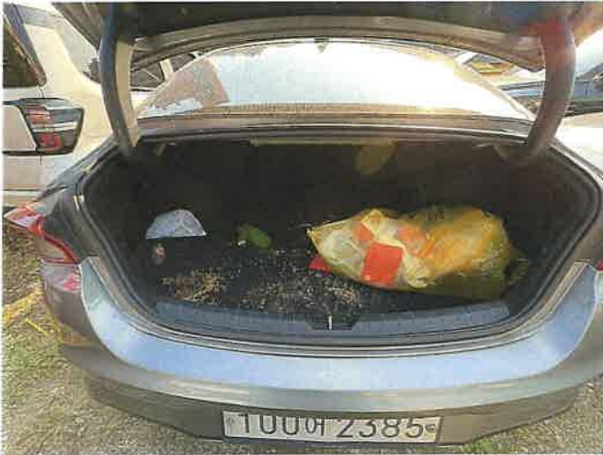
본건 차량 트렁크