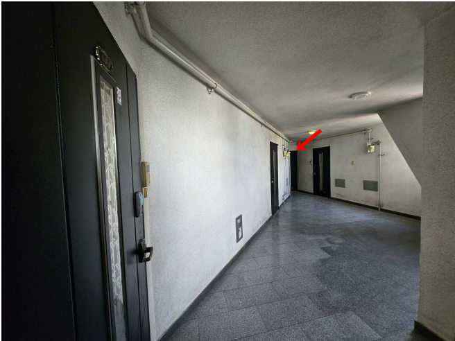
본건소재 5층 및 본건현관문 전경