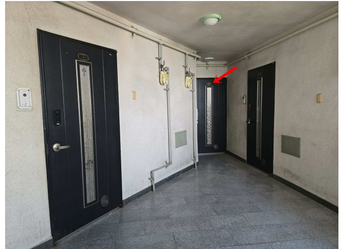
본건소재 5층 및 본건현관문 전경