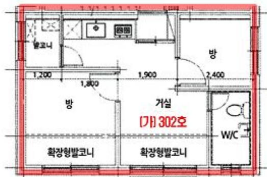
【 호별배치도 】