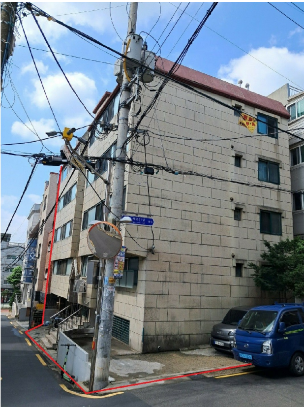
( : )