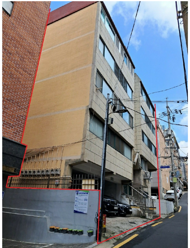
( : )