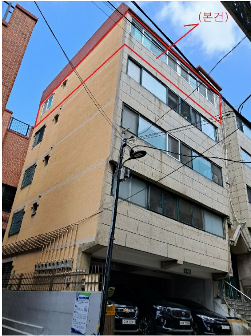
4 402 ( : )