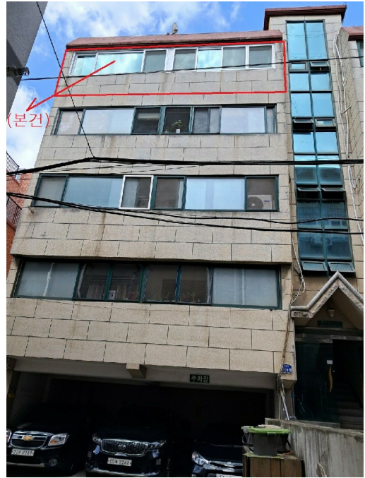
4 402 ( : )