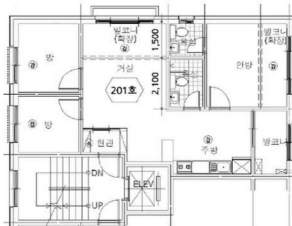
[ 내부구조도 ]