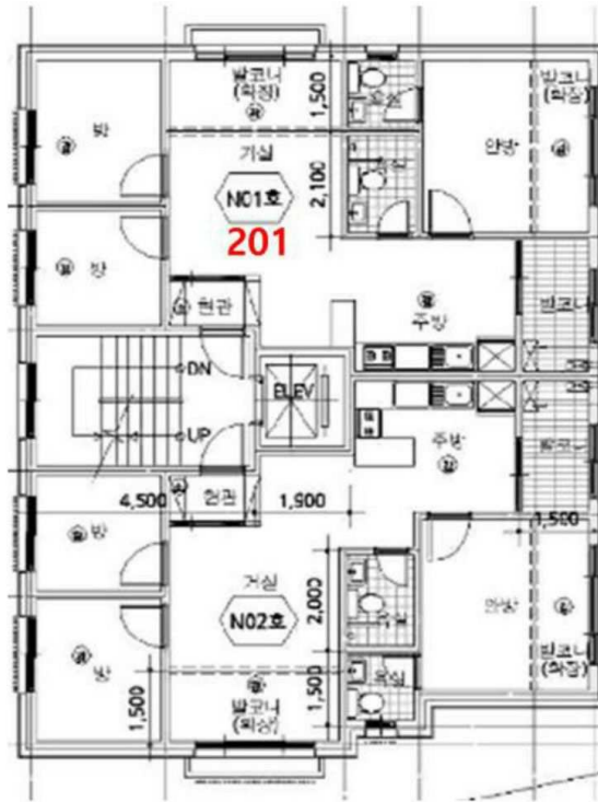
[ 호별배치도 ]