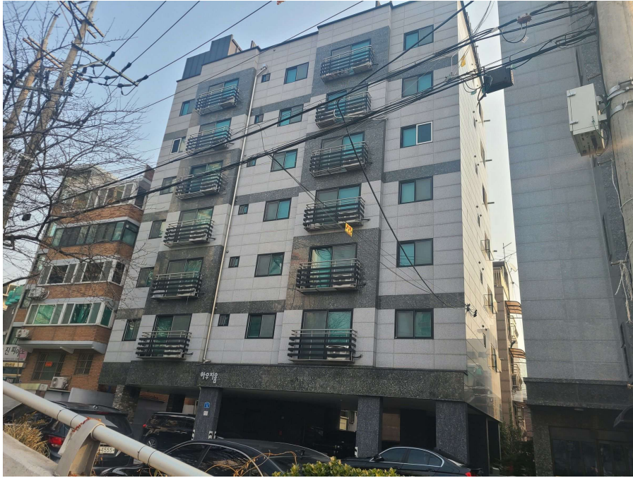
< 대상물건 건물 전체전경 >