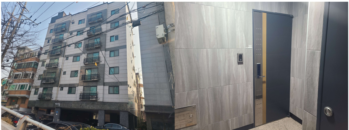
〈대상물건 현관 전경〉