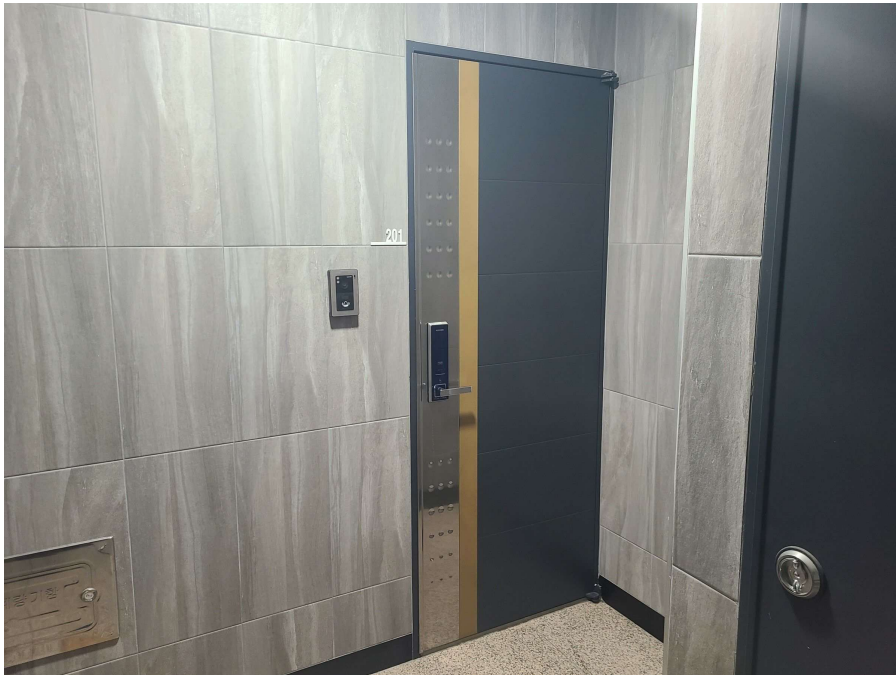
< 대상물건 현관문 전경 >