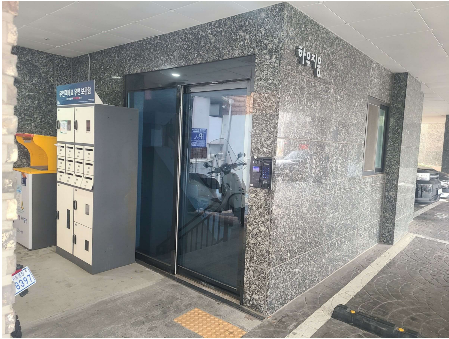
< 대상물건 건물 1층 주출입구 >