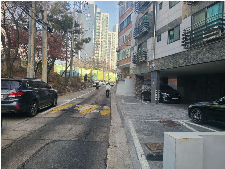
< 대상물건 주위환경 >