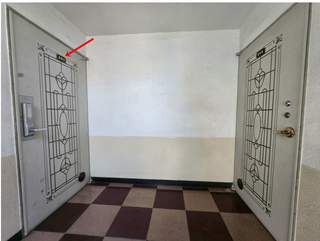
본건소재 2층 및 본건 현관문 전경