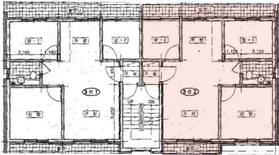
[ 호별배치도 ]