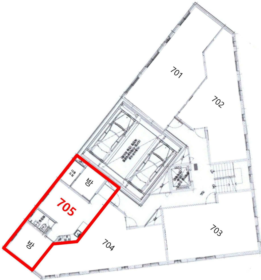
< 호별배치 및 내부구조 >