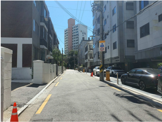
주 위 환 경