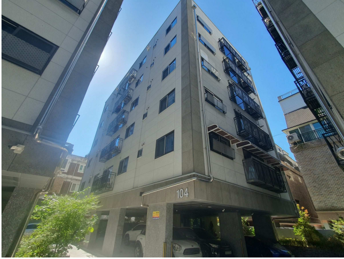
본건 건물 전경