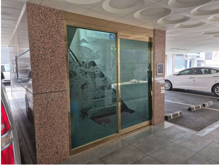
< 대상물건 주출입구 전경 >