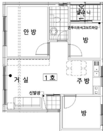
<<(1) 제2층 제201호>>