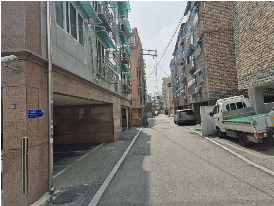
< 주위환경 >