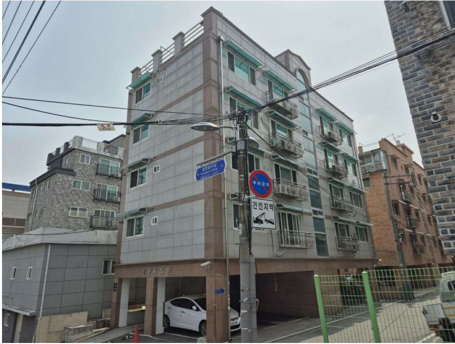
< 대상건물 전체 전경 >