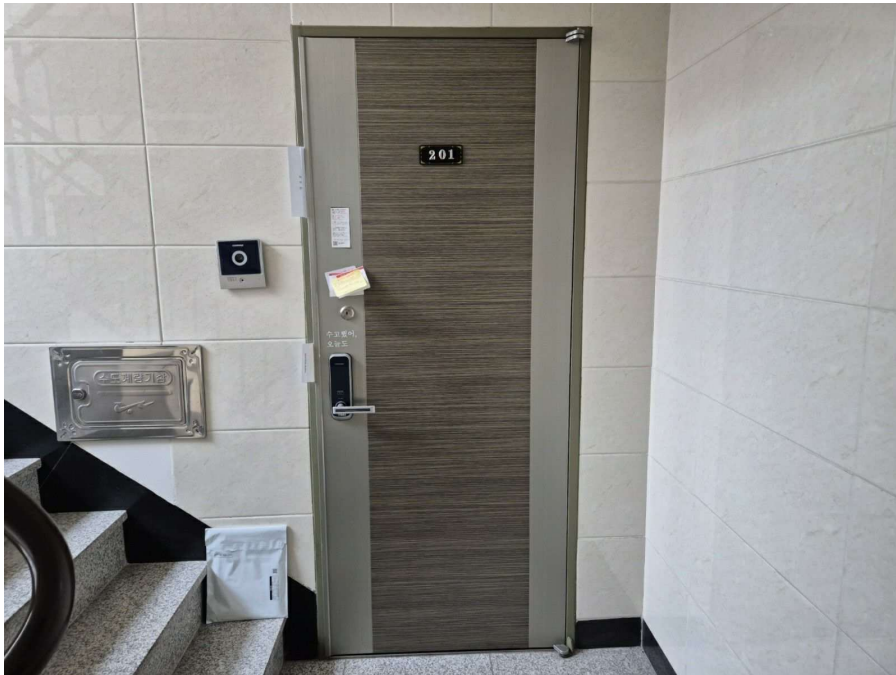
< 대상물건 현관문 전경 >