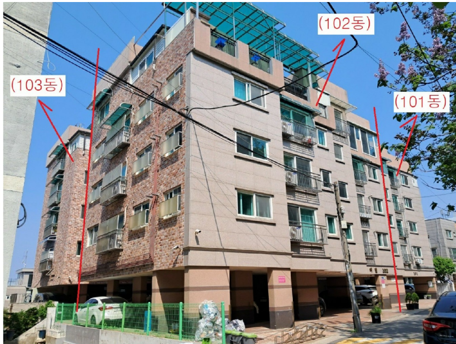
101 , 102 , 103