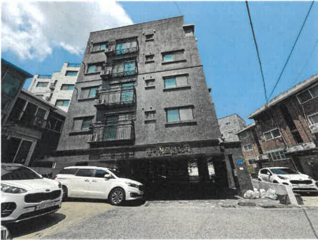
본건 건물 전경