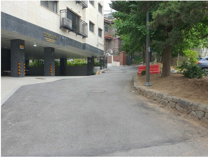
주 위 환 경