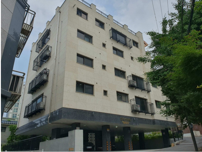
본건 건물 전경