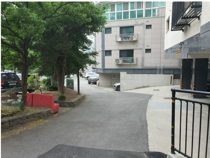
주 위 환 경