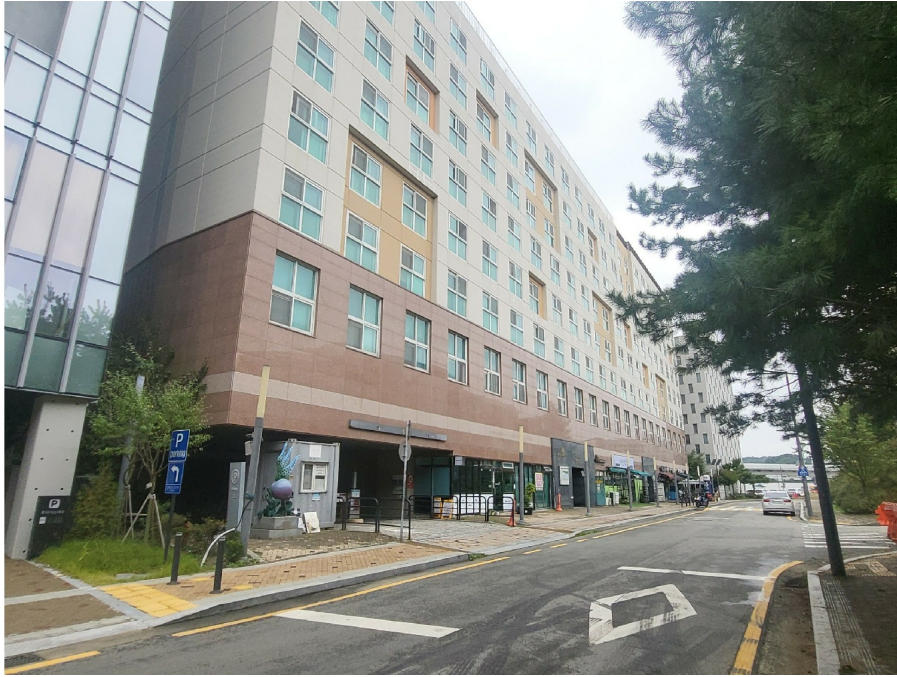
[ ( ) ]