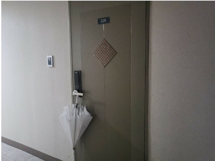
[ (3 326 ) ]