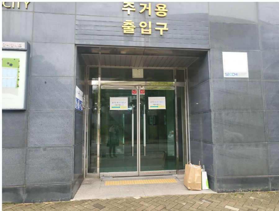
[ 1 ]