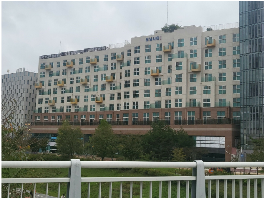
[ ( ) ]