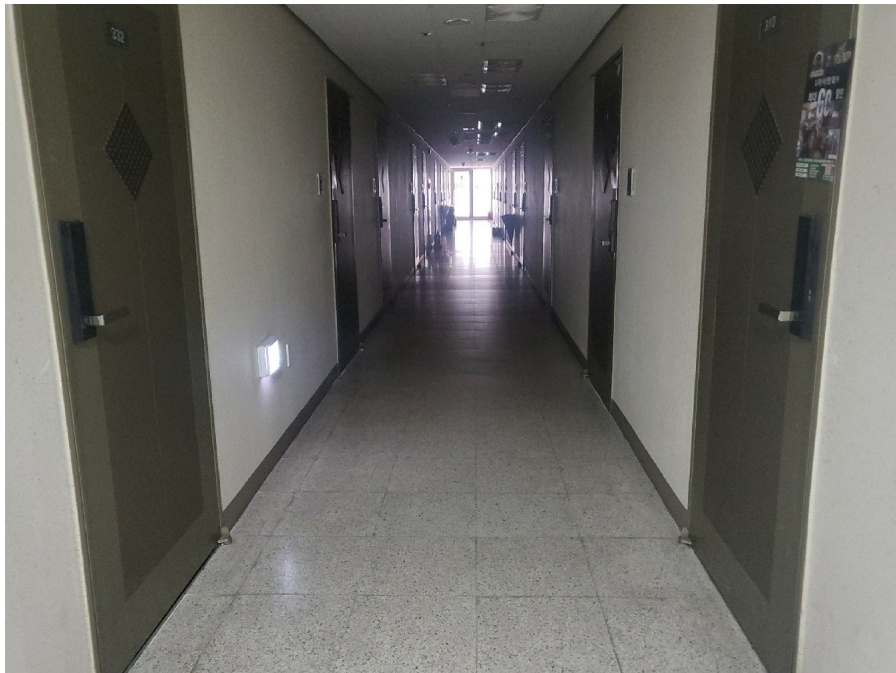
[ 3 ]