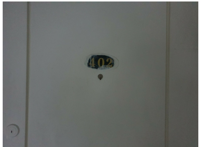
( 4 2 )