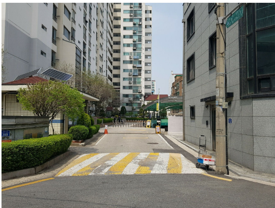
본건 소재 단지 진출입구(남측에서 촬영)