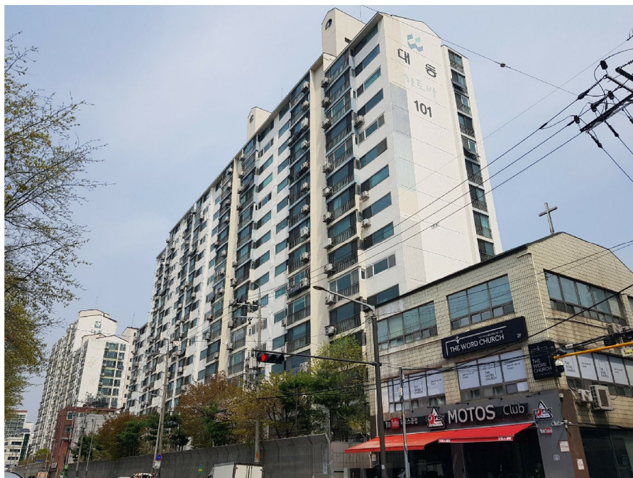
본건 소재 제101동(남서측에서 촬영)