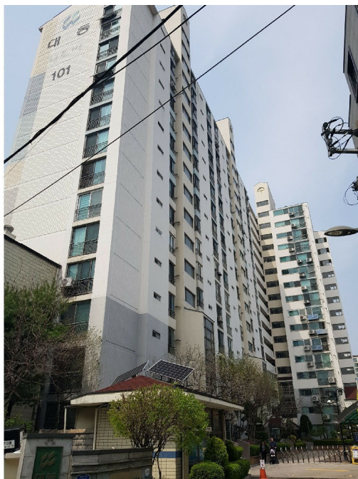
본건 소재 제101동(남동측에서 촬영)