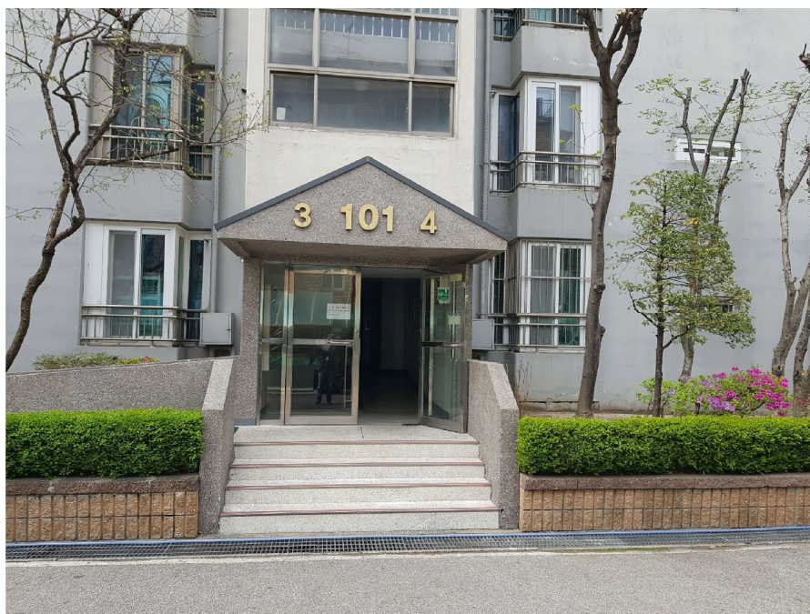
공동 출입구(동측에서 촬영)