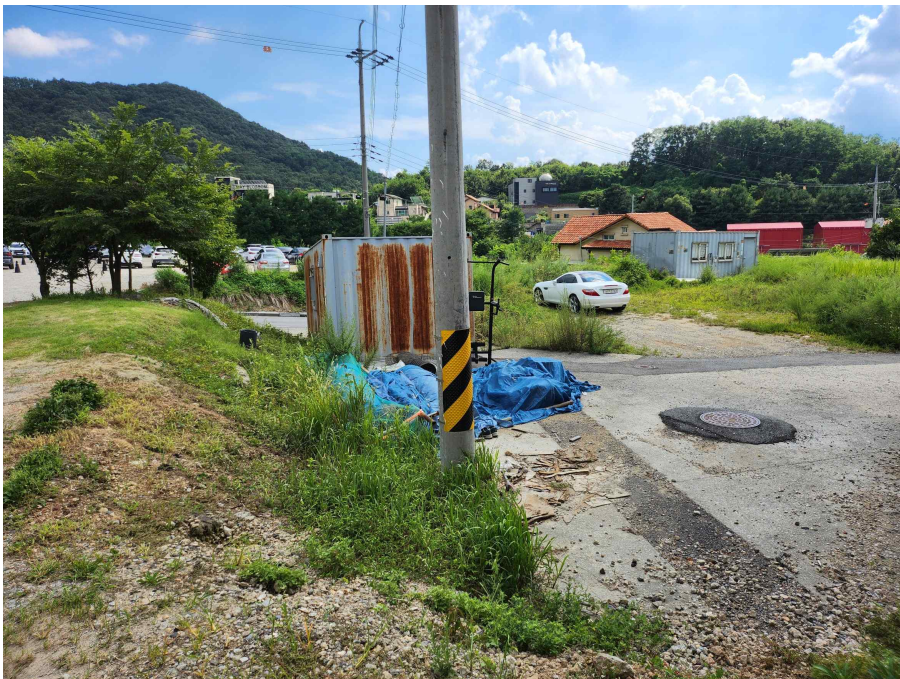
북측에서 본 대상토지