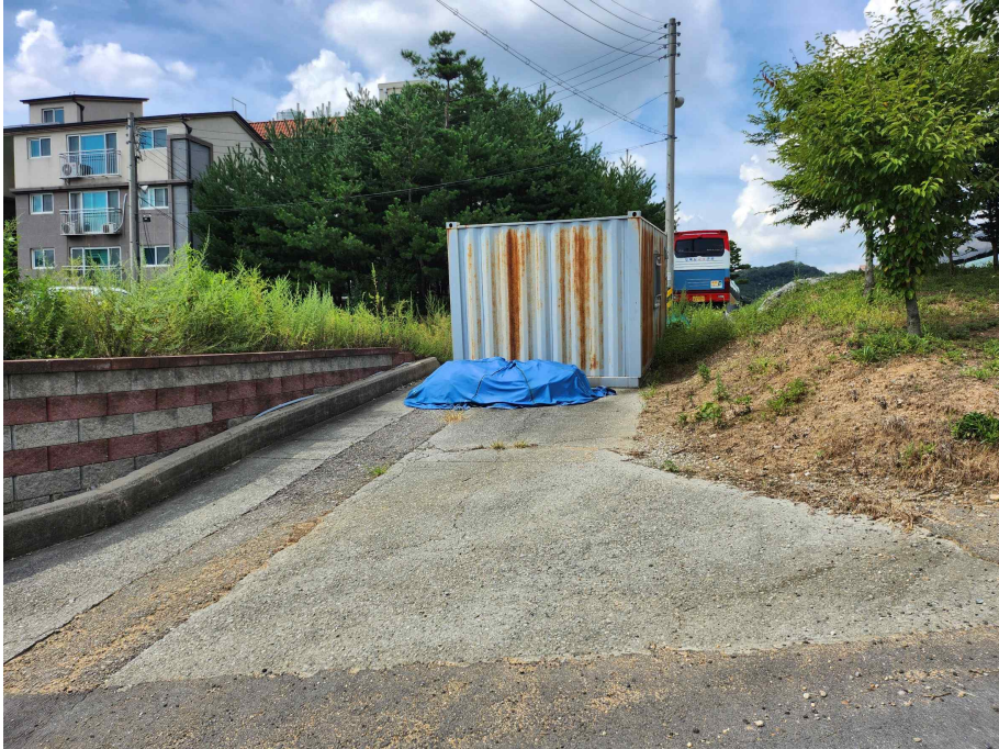
남동측에서 본 대상토지