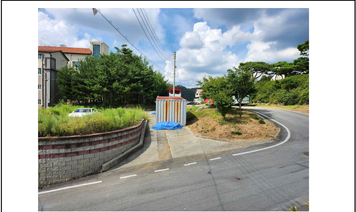
남측에서 본 본건 전경