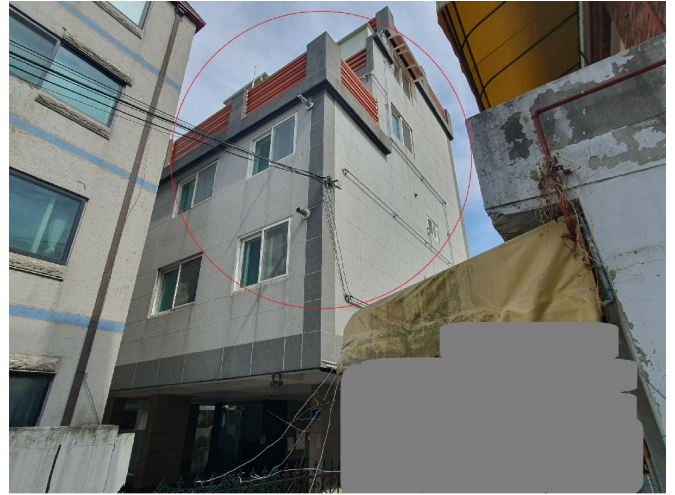
( . )