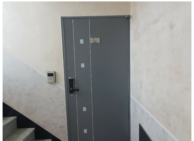
( 401 )