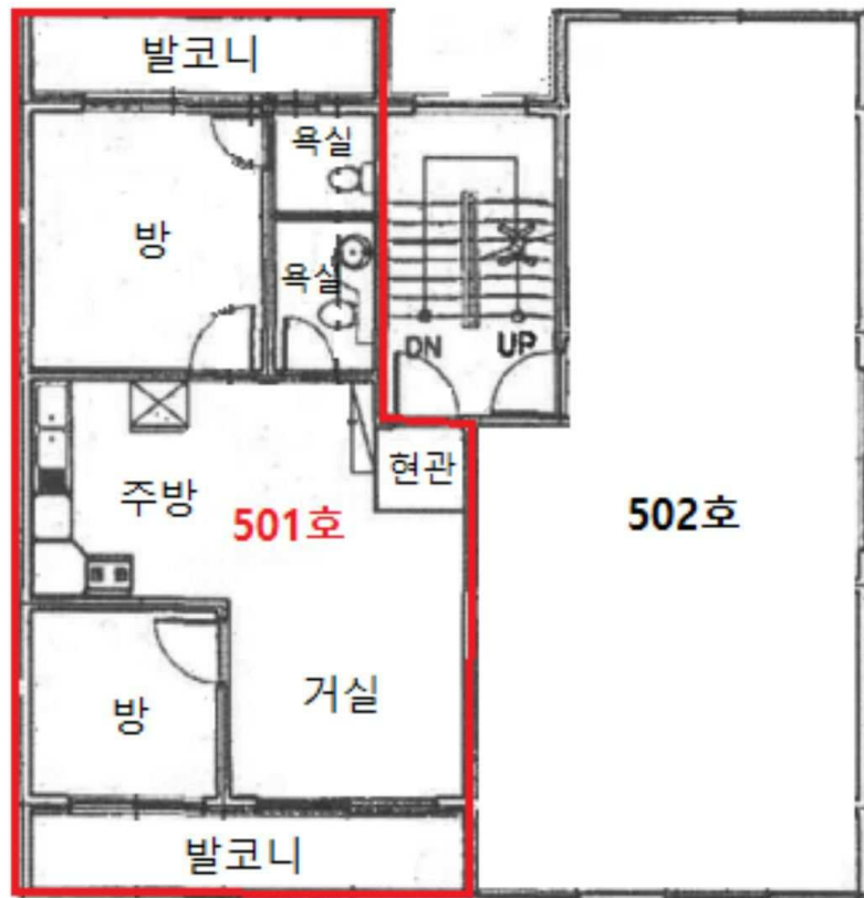
<호별배치도 및 내부구조도>