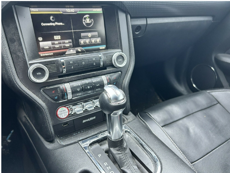
( 1 )