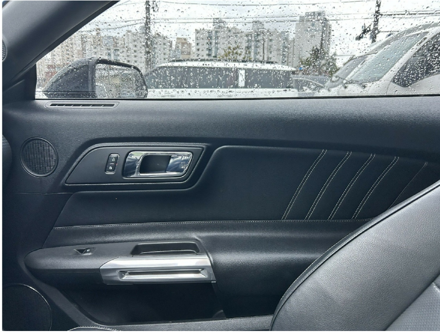
( 1 )