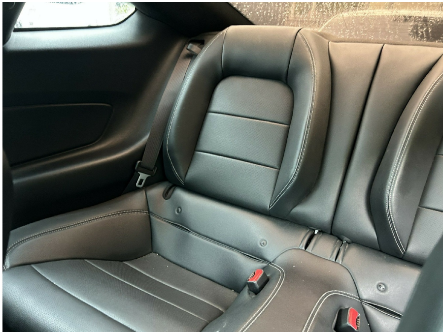
( 2 )