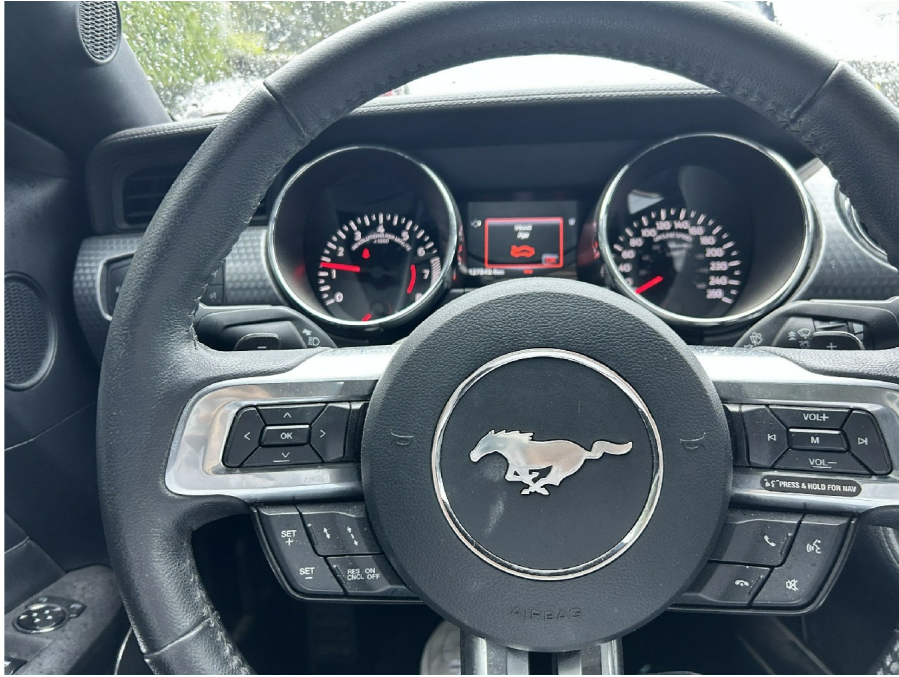
( 1 )