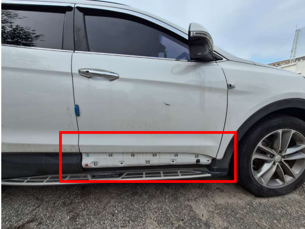
<파손 부분 및 스크래치 등>