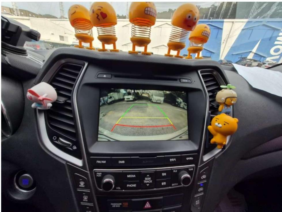
<후방 카메라 등>