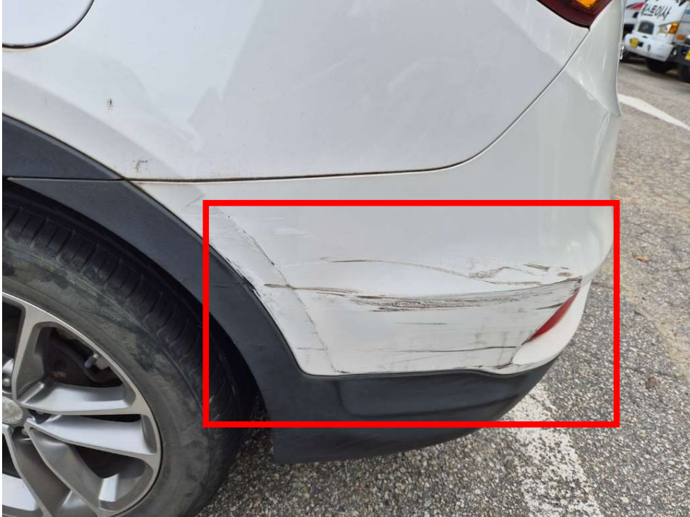
<파손 부분 및 스크래치 등>