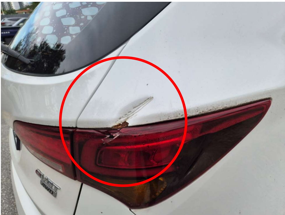
<파손 부분 및 스크래치 등>