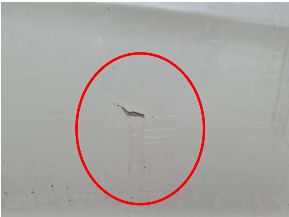
<파손 부분 및 스크래치 등>