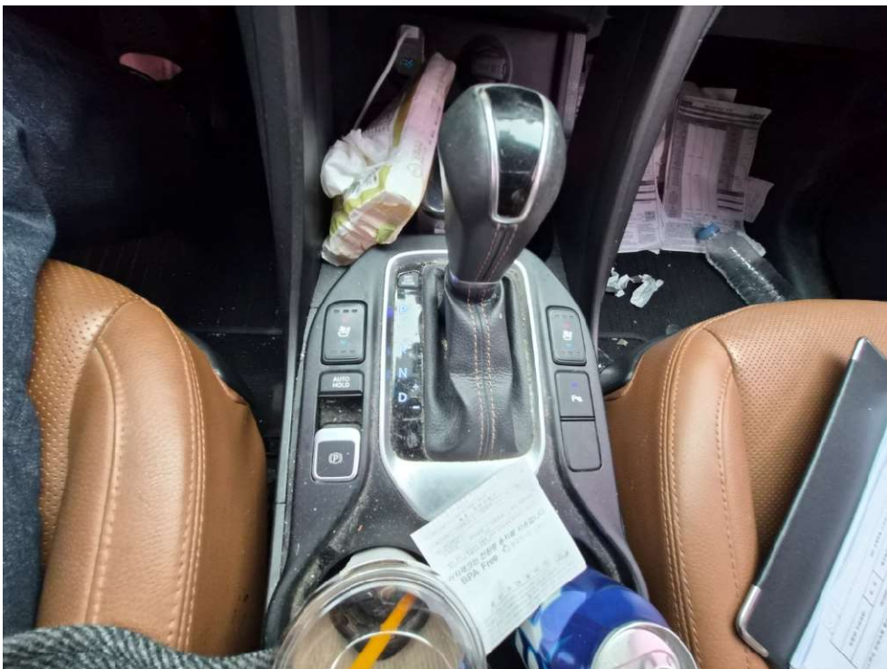
<변속 기어 부분>