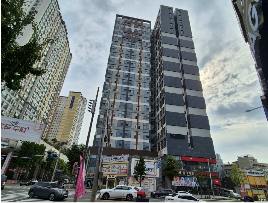
오피스텔 전경(서측에서 촬영)