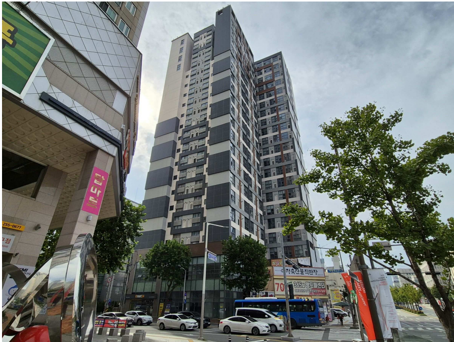
오피스텔 전경(북서측에서 촬영)