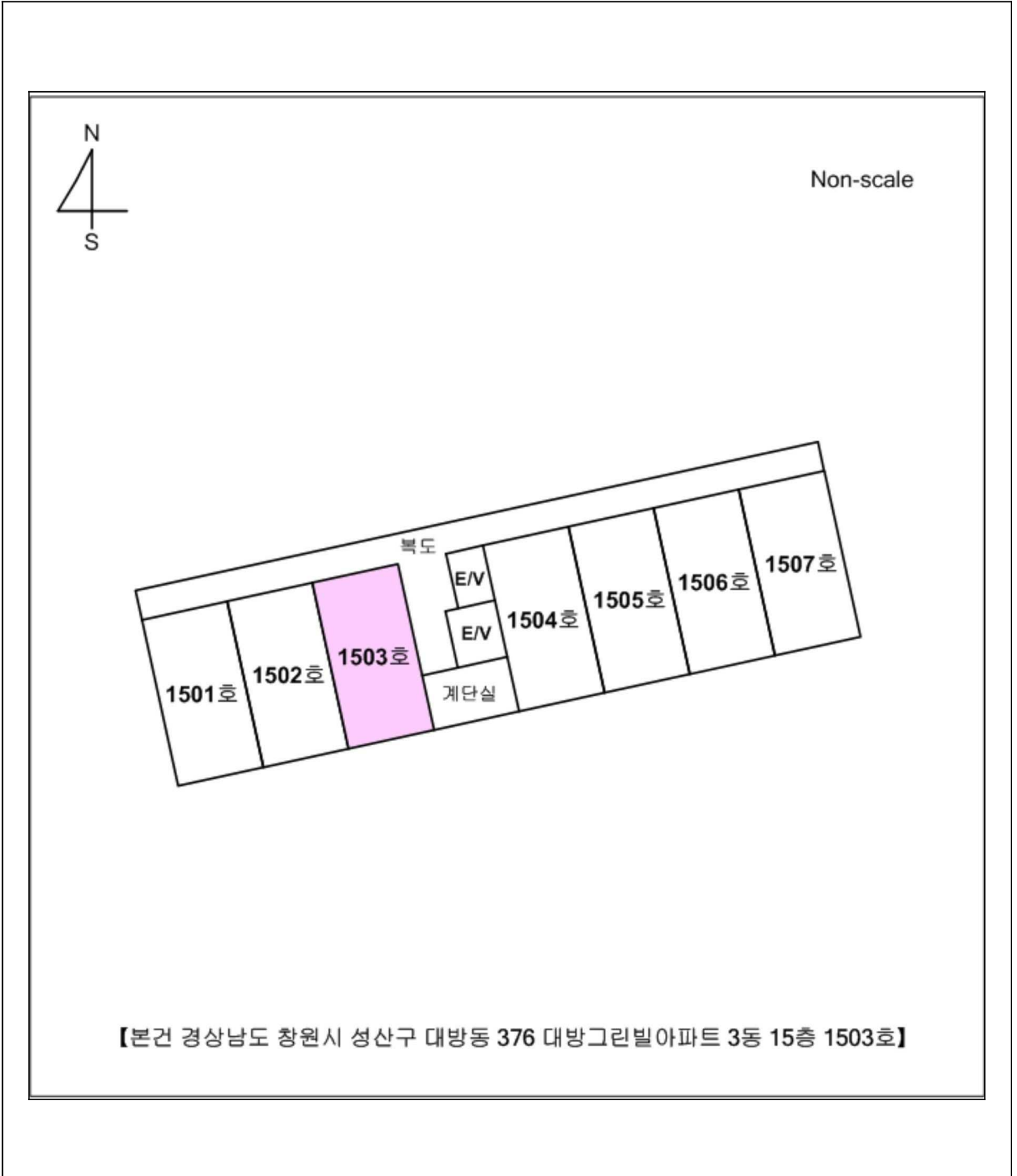
【본건 경상남도 창원시 성산구 대방동 376 대방그린빌아파트 3동 15층 1503호】