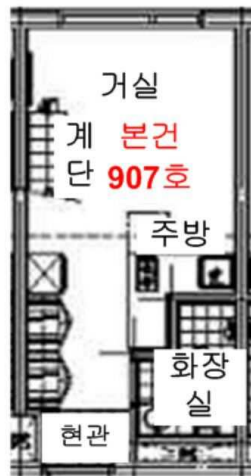
【기호(1) 907호 내부구조도】