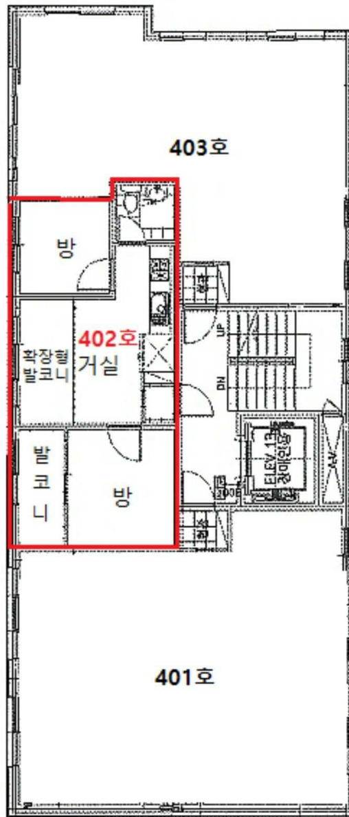
<호별배치도 및 내부구조도>