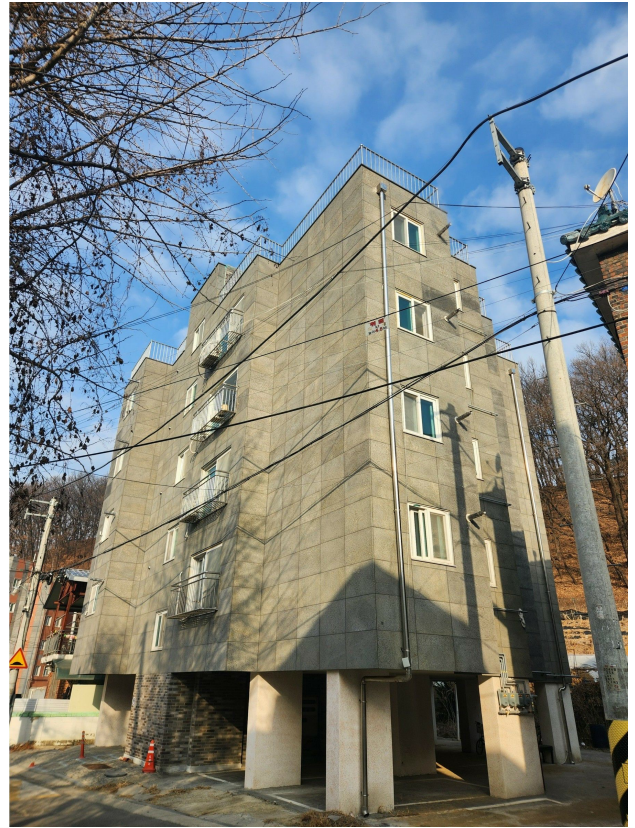
본건 동 전경(남동측에서 촬영)