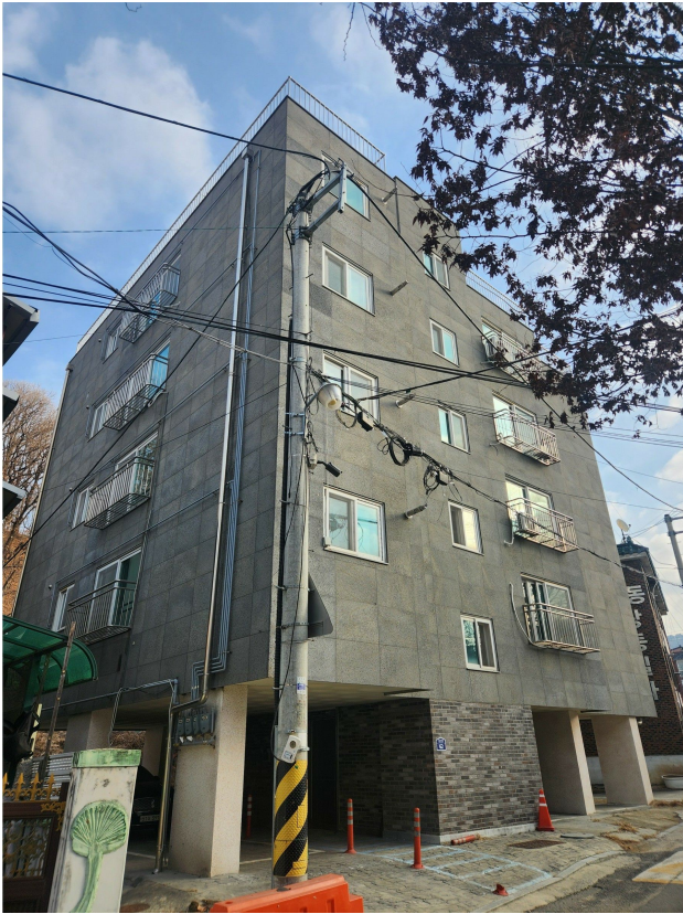
본건 동 전경(남서측에서 촬영)