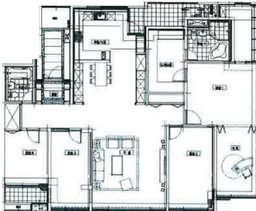
[본건 "지행역휴먼빌아파트" 제101동 제8층 제803호]