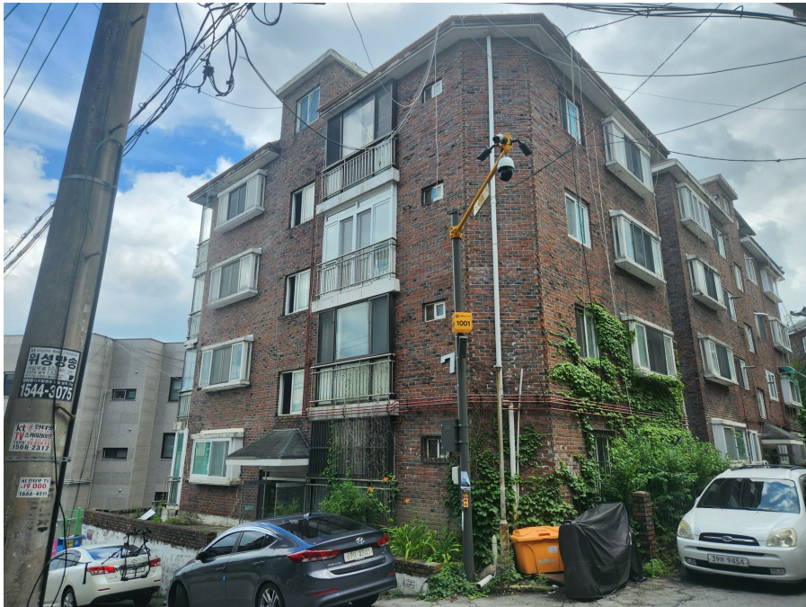
본건 동 전경