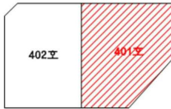
[ 4층 배치도 ]