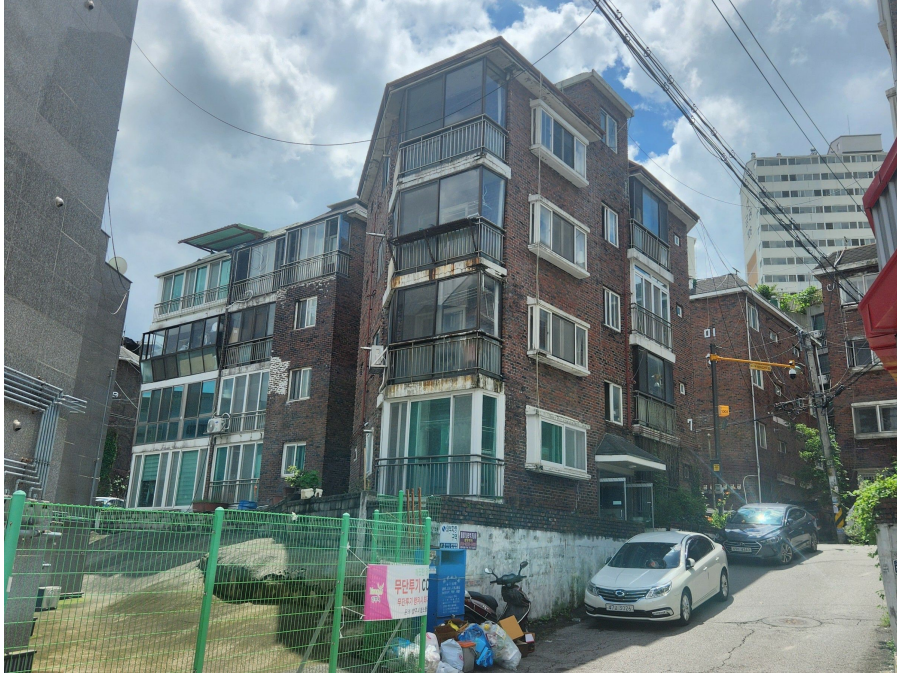
본건 동 전경