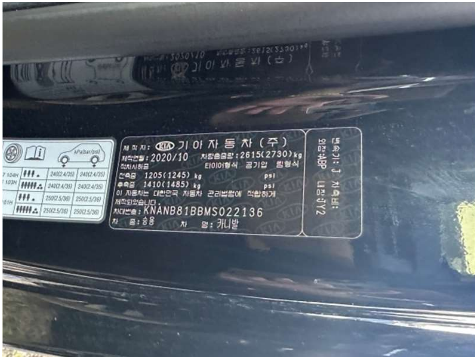
본건 차량 명판