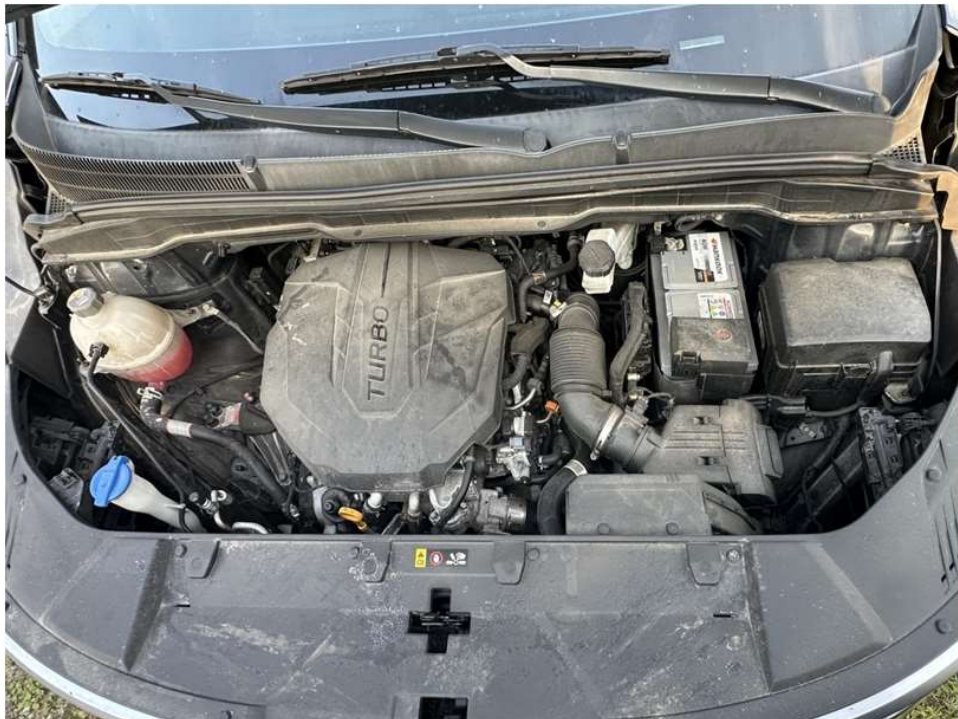
본건 엔진룸 전경