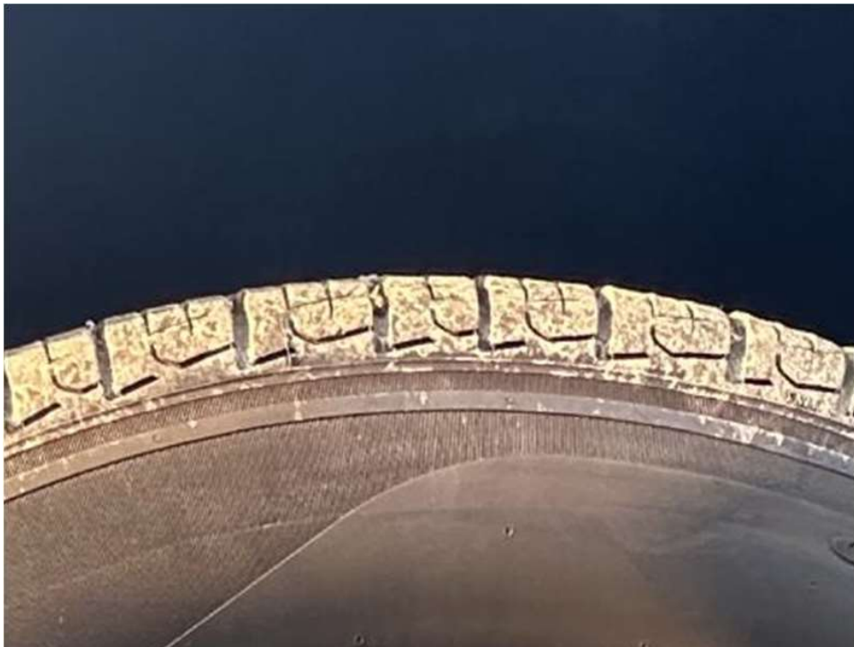
전방 운전석측 타이어