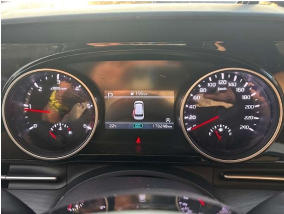
본건 계기판(주행거리 : 170,248km) 전경