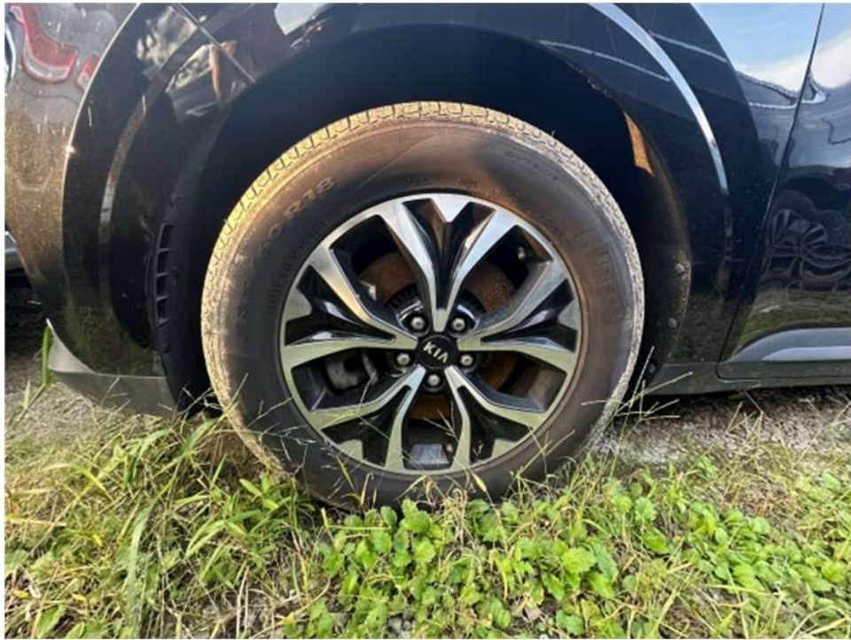
전방 운전석측 타이어