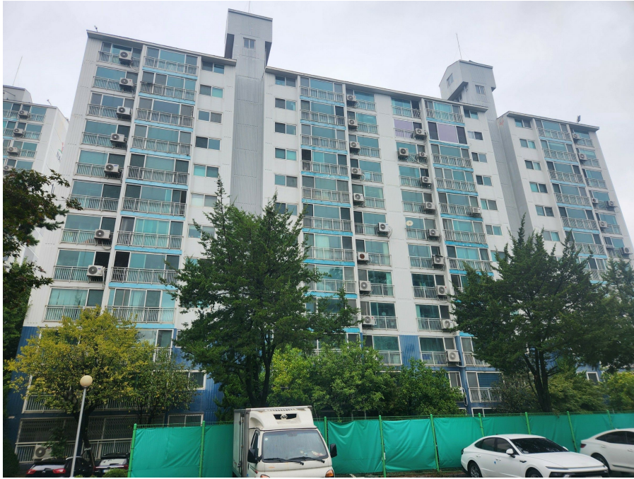
본건 동 전경