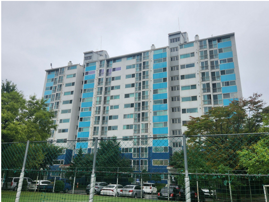
본건 동 전경