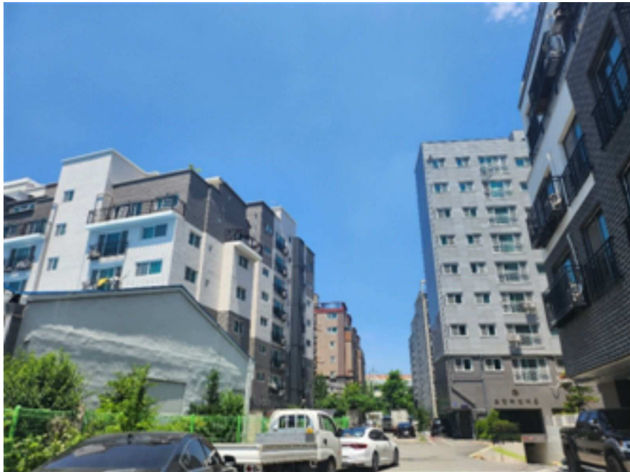
[ 주 위 전 경 ]