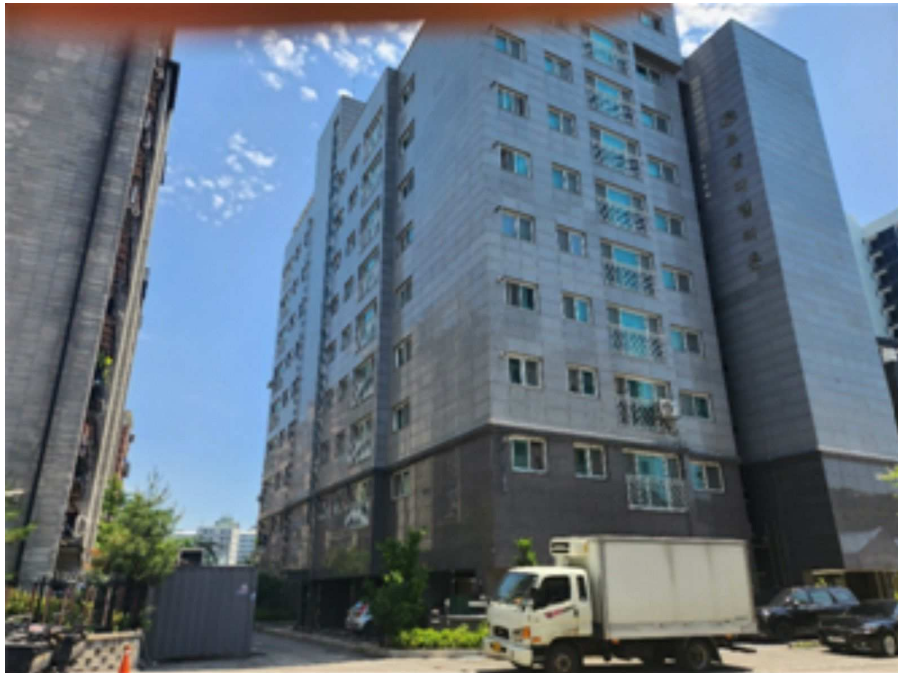
[ 본 건 전 경 ]