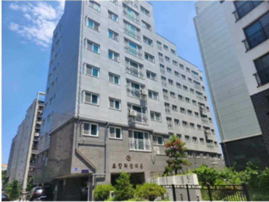
[ 본 건 전 경 ]