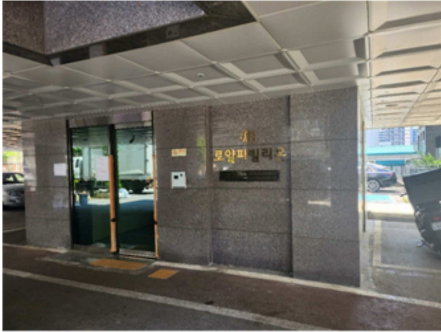
[ 출 입 구 전 경 ]