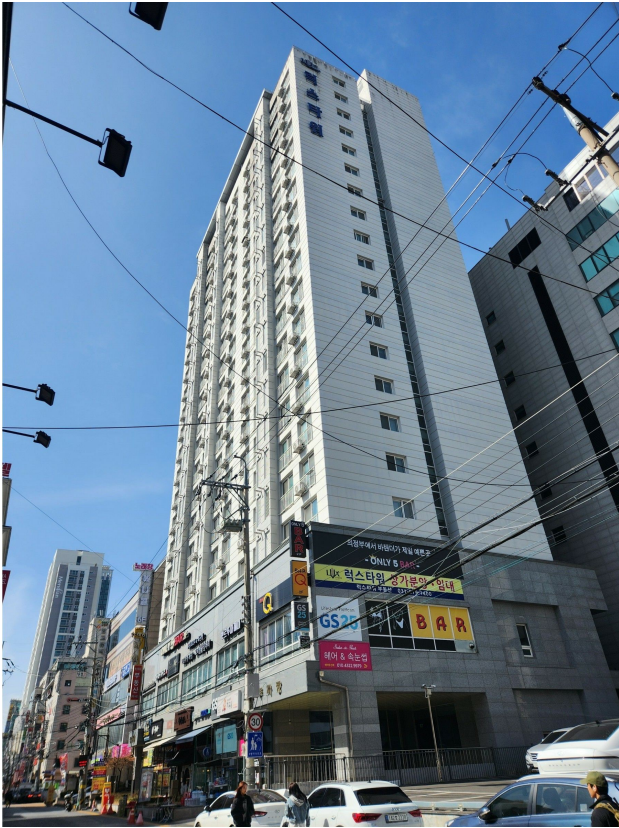
본건 동 전경