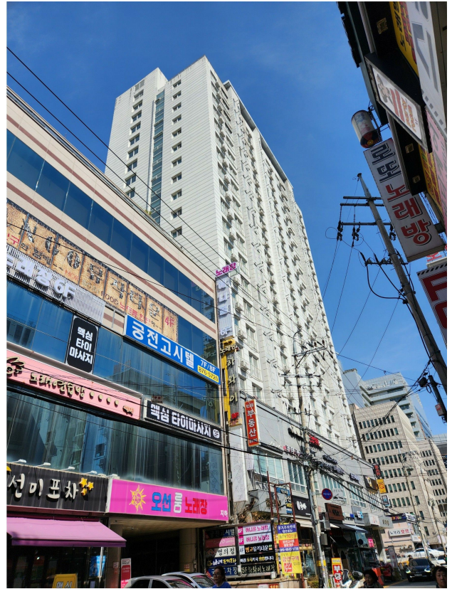
본건 동 전경