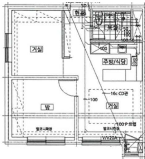
[ 내부구조도 ]