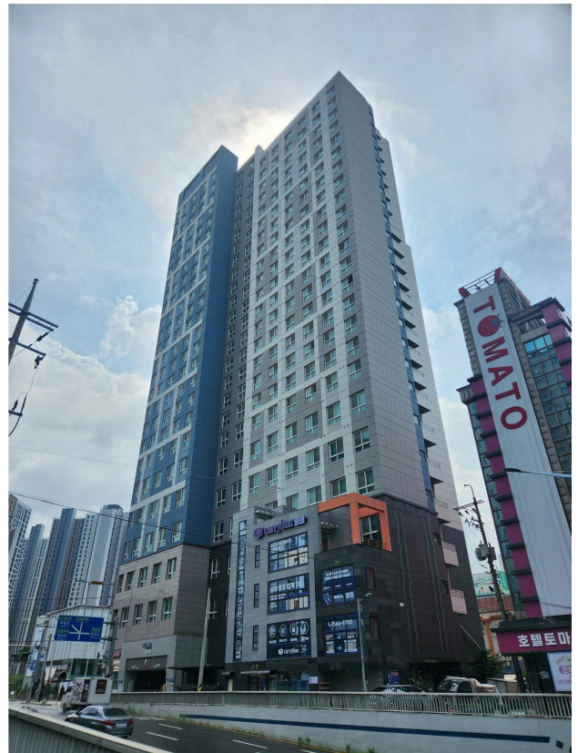
본건 동 전경