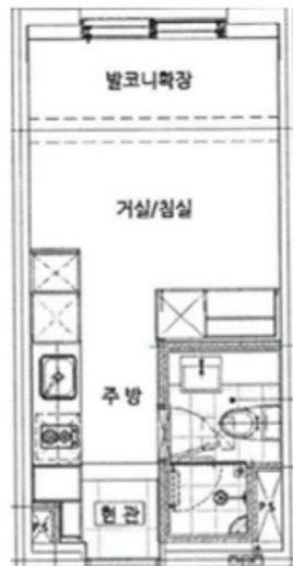
[ 내부구조도 ]