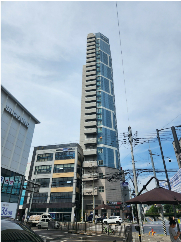
본건 동 전경