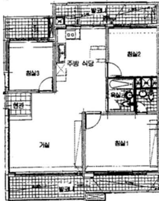
[본건 "은동마을주공1단지" 제110동 제18층 제1803호]

본건은 현장조사시 이해관계인의 부재로 인하여 내부 구조 및 이용상태 등은 집합건축물대장상 건축물현황도 등에 의하여 표준적인 상황을 기준하였음.