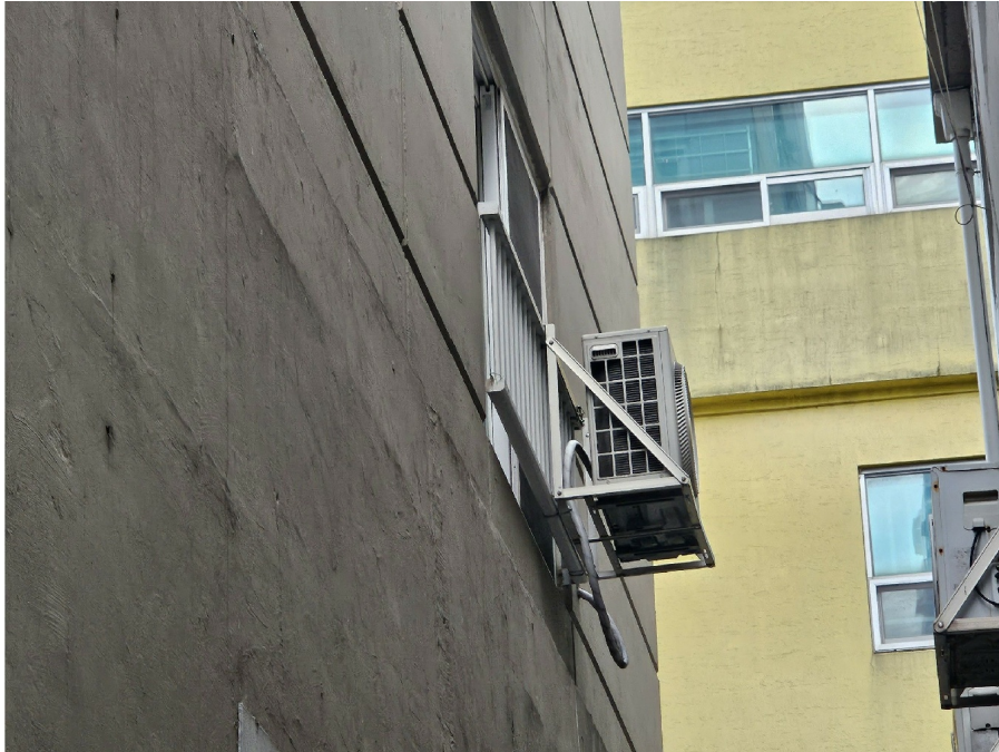
( 2 201 )