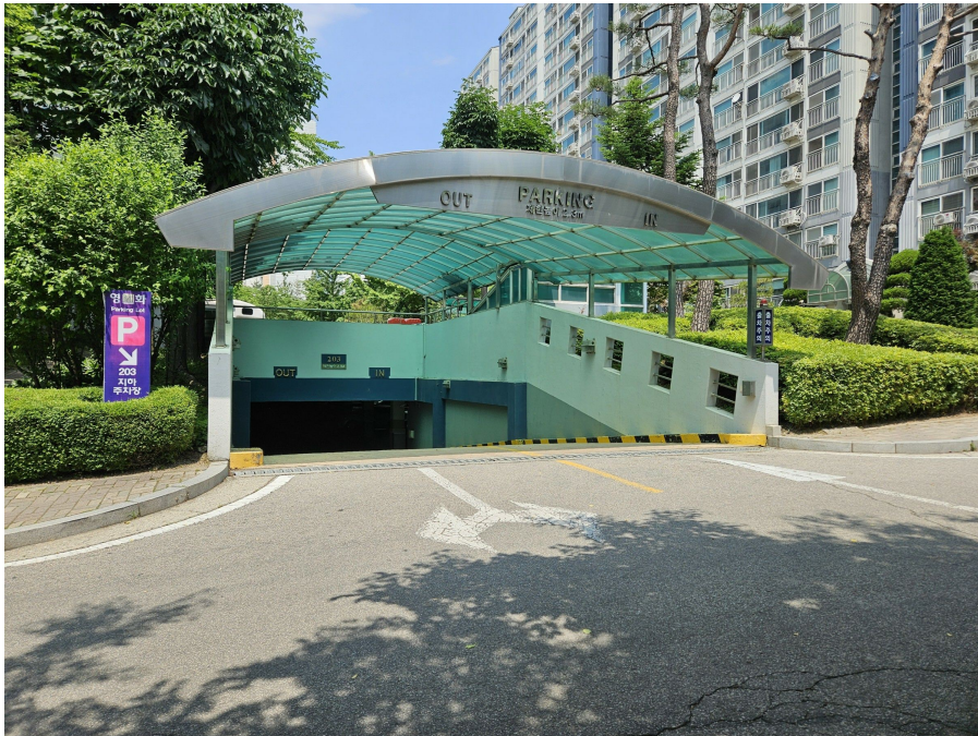
지하 주차장 출입구