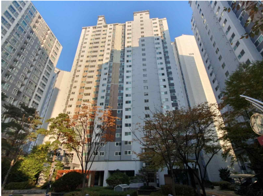
본건전경 - 녹양힐스테이트 제105동