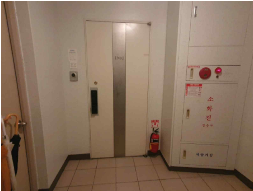
본건 - 녹양힐스테이트 제105동 1901호 출입문