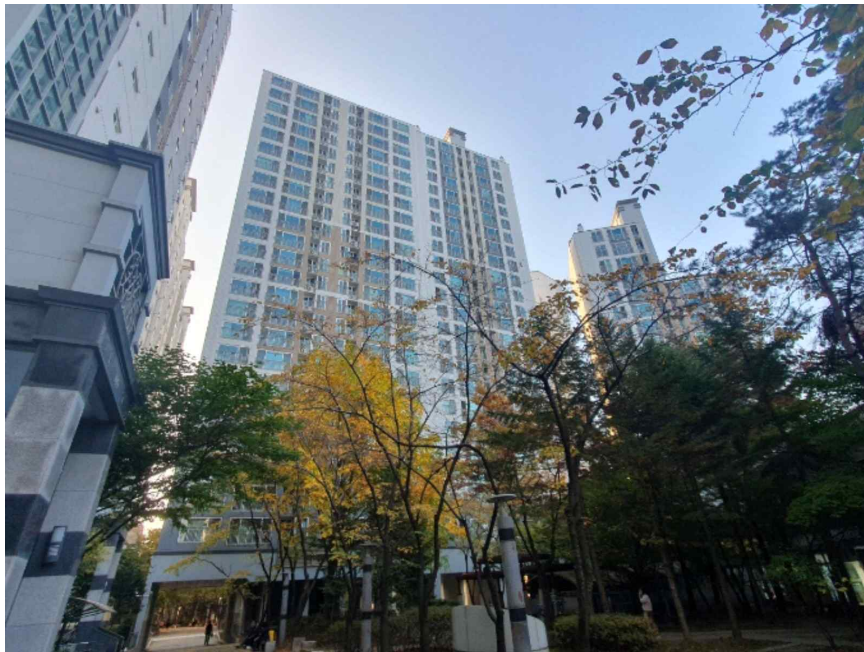
본건전경 - 녹양힐스테이트 제105동