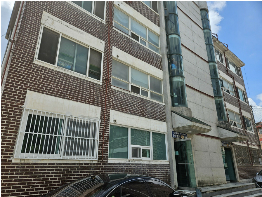
본건 동(한양빌라 5차 비동(현지에서는 나동))