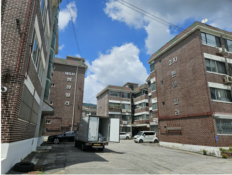
단지 내 전경