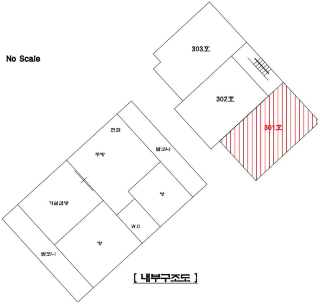
[ 내부구조도 ]