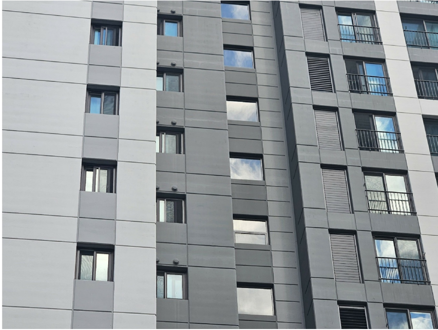
( 12 1203 )