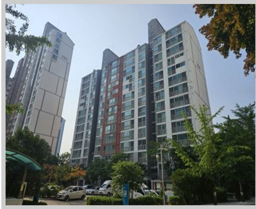
【 304 】