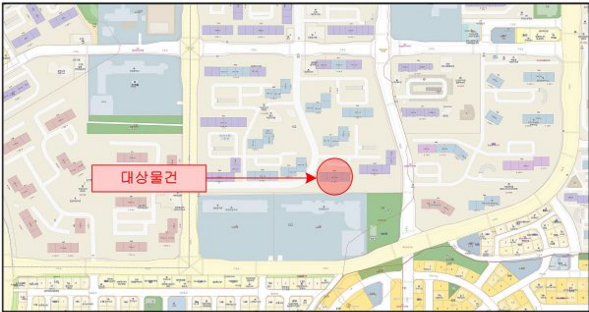
호별배치도 및 내부개황도(축척없음)