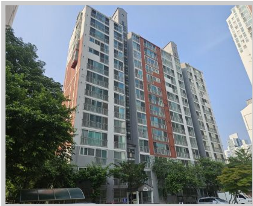
【 304 】