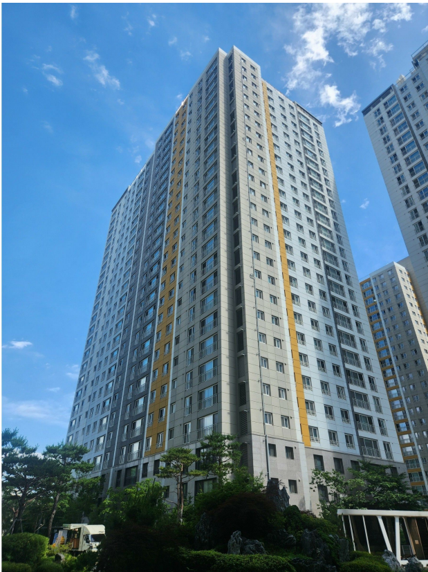
본건 동 전경