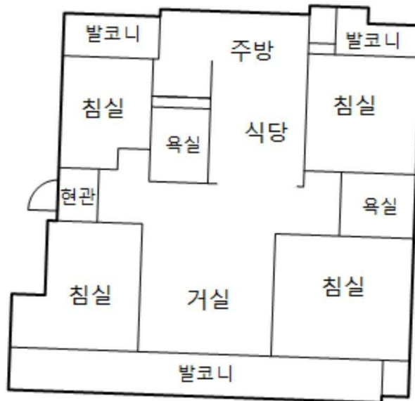
['호원우성아파트(1차)' 제101동 제8층 제801호 내부구조도]