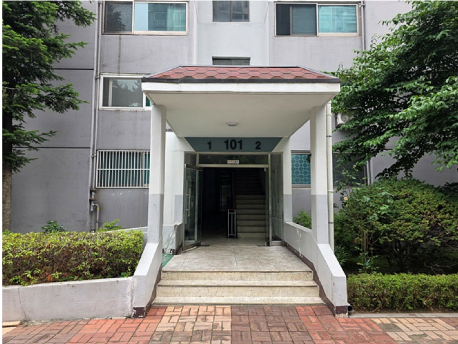
1 , 2