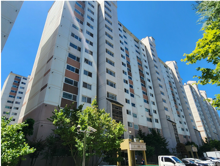
본건 동 전경