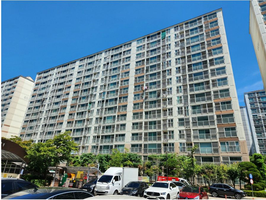
본건 동 전경